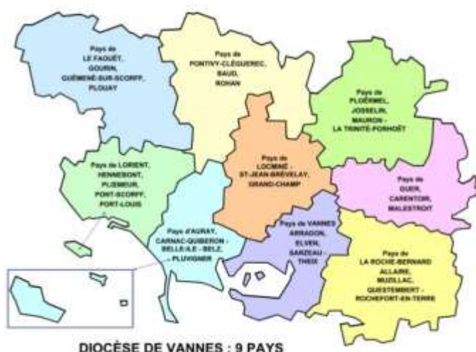
DIOCÈSE DE VANNES : 9 PAYS

Désormais, il n'y aura qu'un seul doyenné : le doyenné de Questembert qui remplacera le Pays de Vilaine. Pourquoi Questembert ? Questembert est central par rapport au doyenné. De plus, Questembert a une nouvelle salle paroissiale pratique pour les réunions. Cette salle servira pour les rencontres de recteurs et aussi lors de propositions de rencontres pour le nouveau doyenné. Nous continuerons de rester au plus près de notre réalité d'Allaire et faire vivre nos salles.