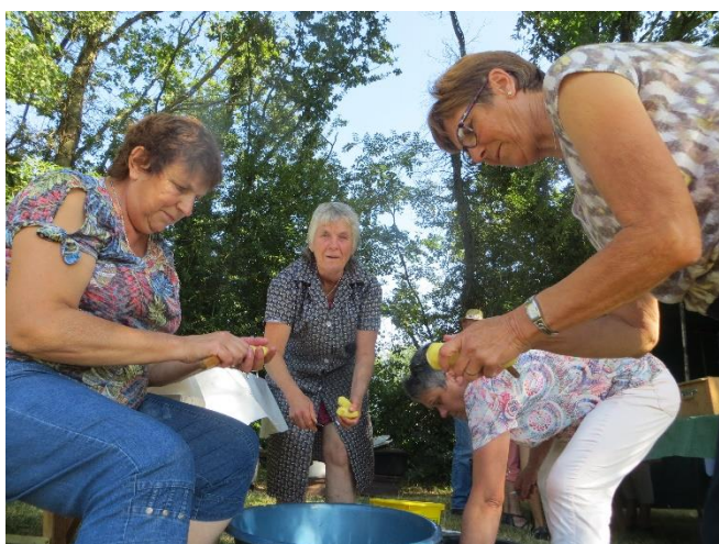
Tandis qu'on épluche les patates...