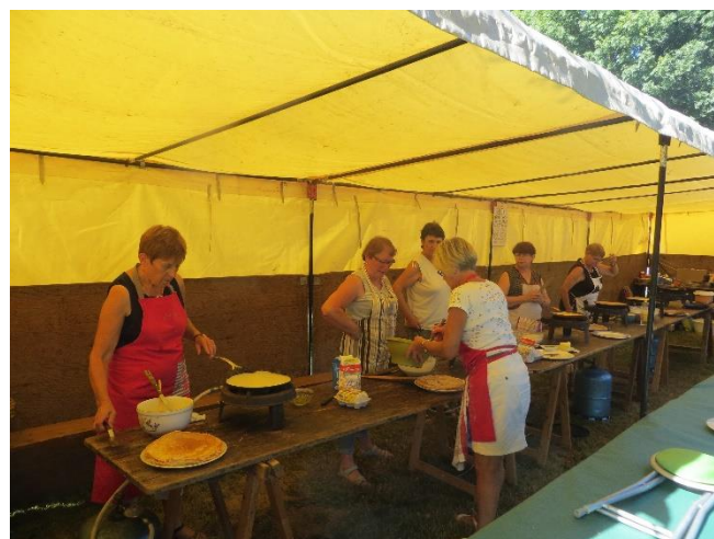
D'autres cuisent crêpes et galettes sur le billic.