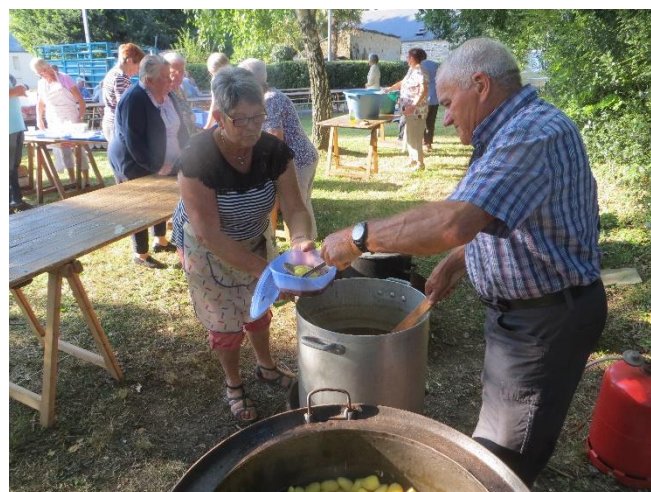
Que les convives dégusteront le soir...