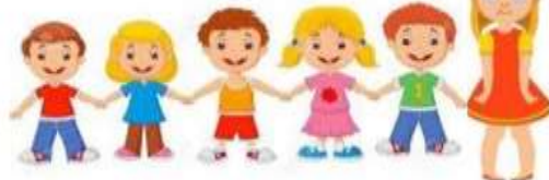
Un groupe d'enfants heureux