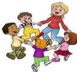
Une ronde d'enfants