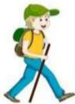
Quelqu'un en balade dans la nature