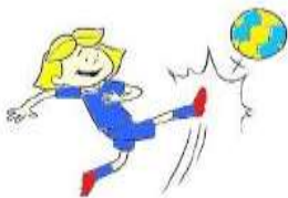
Un enfant qui joue au ballon