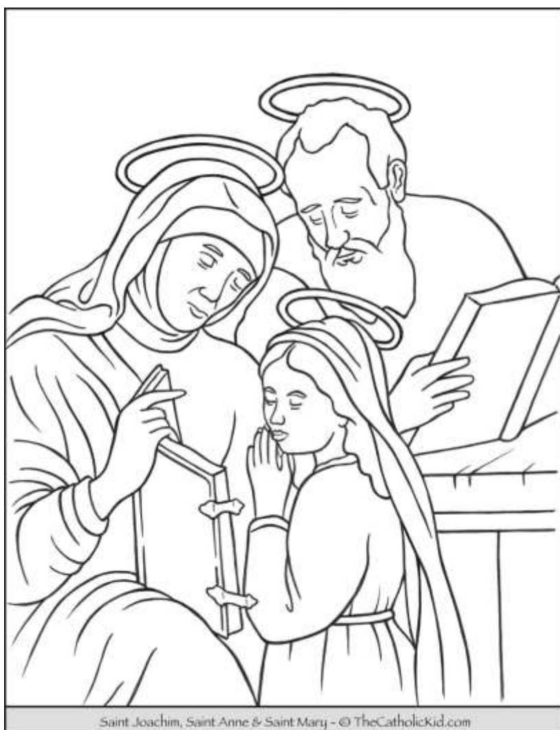
Saint Joachim, Saint Anne & Saint Mary

Quand Anne et Joachim ont eu Marie, ils étaient déjà bien vieux.