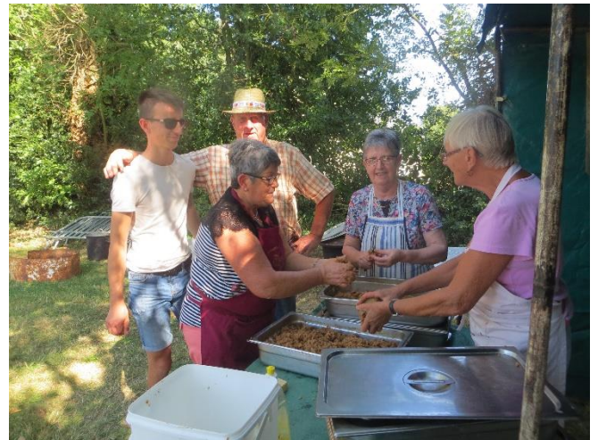
Ou qu'on émiette la fricassée...