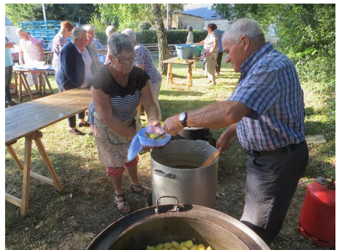
Que les convives dégusteront le soir...