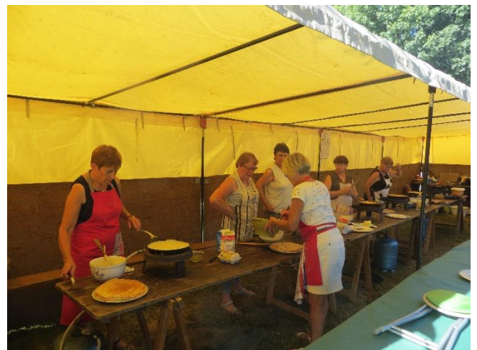
D'autres cuisent crêpes et galettes sur le billic.