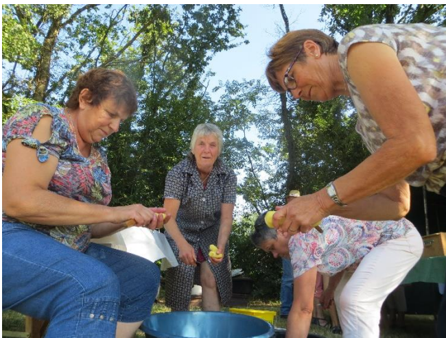
Tandis qu'on épluche les patates...